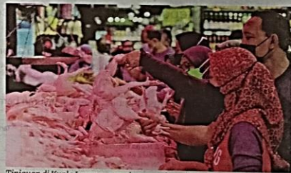
Tinjauan di Kuala Lumpur, semalam mendapati bekalan ayam masih stabil.