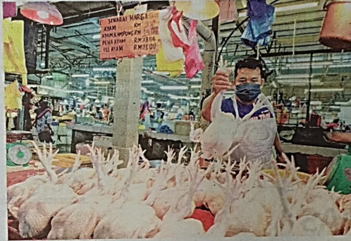
AYAM merupakan makanan yang sering mengalami 'perang' harga ekoran pelbagai faktor. — GAMBAR HIASAN

Gembira dapat meraikan Aidilfitri bersama keluarga