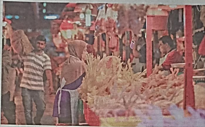
Masalah bekalan ayam sehingga mengakibatkan permintaan melebihi penawaran di pasaran menyebabkan peningkatan harga yang membebaskan pengguna.

Pelbagai modus operandi yang 'se-ngaia' dilakukan kartel demi mengawal