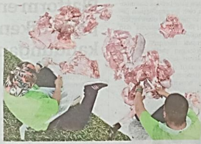
HARGA satu bahagian lembu korban yang dijual sehingga RM1,000 tidak menghalang orang ramai melaksanakan ibadah berkenaan.