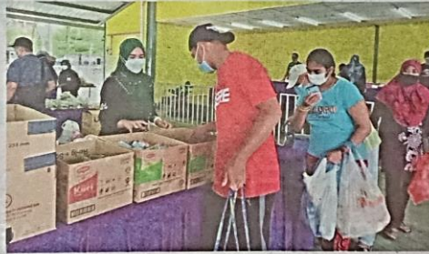
Helping hand: Families in need of assistance picking up basic necessities at the free market event in Johor Baru.