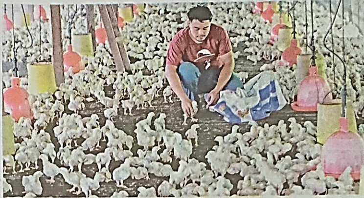
KERAJAAN dicadangkan menubuhkan lembaga unggas dengan diberi kuasa bagi menyekat monopoli kartel dalam industri ayam, sekaligus memastikan bekalan sentiasa cukup dalam pasaran.

"Tindakan ini sekali lagi membuktikan pengaruh kartel tersebut dalam strategi dan penggubalan dasar kerajaan sedia ada," katanya tanpa menam-